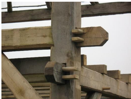
Authentieke ankerbalk verbinding

Levering en plaatsing van een H&G Tasberg per 01-01-2021